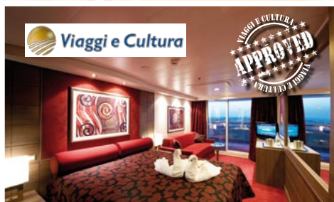
cabina esterna con balcone cat. 7